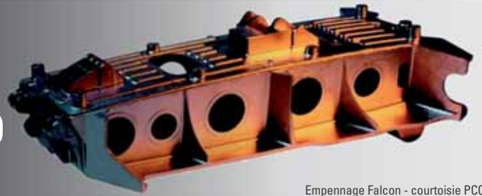
Empennage Falcon